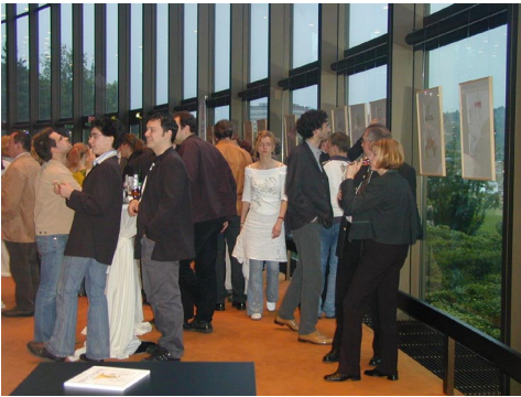
„Blechvögel“ im Brucknerhaus 2003 und 2004

Wichtig wär auf alle Fälle, dass einige Bilder eine Zeit lang in der Schule hängen würden. Die zur Auswahl stehenden Teilprojekte sollte man in Absprache mit den Lehrern auswählen - passend zum Alter, Interesse und Lehrplan.