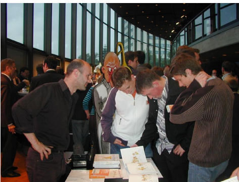
„Blechvögel“ als Buch