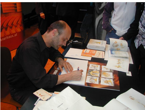
... beim Signieren der Bücher